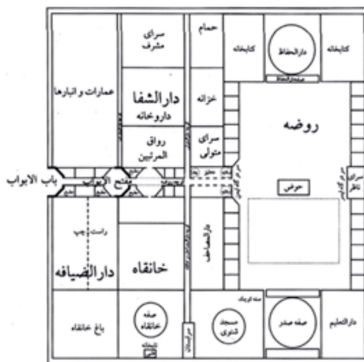
نگاره ۱: تعیین مکان دقیق فضاها در ربع رشیدی مطابق وقف‌نامه

بی‌ت‌التعلیم؛ ۲- آموزش حرفه‌ای؛ ۳- مدارس عالی؛ ۴- دارالشفاء؛ ۵- خانقاه. در این وقف‌نامه مکان هر کدام از فضاهای مجموعه در وقف‌نامه آمده است (نگاره ۱). محل بیت‌التعلیم که محل تحصیل کودکان کارکنان ربع و عده‌ای کودکان یتیم تبریز بوده است را خانه‌ای در روضه که بزرگترین خانهای روضه است بیان می‌کند و هر ۱۰ دانش‌آموز یک معلم داشته‌اند [همان، ۶۳] و یا در وقف‌نامه جایگاه حجره‌ها را نزدیک در خانقاه و جهت خانه‌های حفاظ معرفی می‌کند و بعضی دیگر را در بالای دارالشفاء، زیرزمین را در جنب گنبد و در برابر حمام توصیف می‌نماید [۲۲].