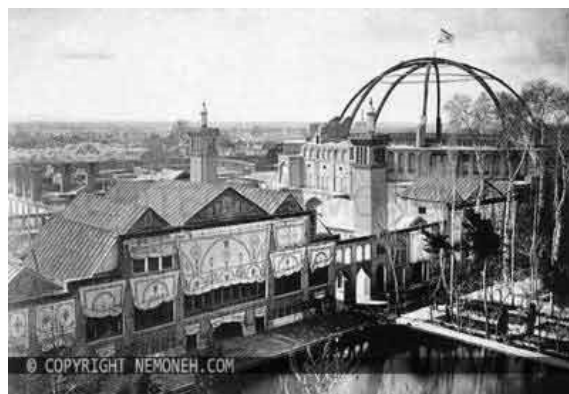
شکل ۲. دارالخلافه ناصری

تکیه دولت، بزرگ‌ترین آملی‌تئاتر ایران در دوره قاجاریه و به دستور ناصرالدین‌شاه ساخته شد (Pourmand and Lezgi, 2008). ساختمان تکیه دولت مدور آجری به قطر تقریبی شصت متر و ارتفاع حدود بیست‌وچهار متر بود و مساحتش را دو هزار و هشتصد و بیست و چهار متر مربع ذکر کرده‌اند. این ساختمان سه طبقه و با سردابه چهار طبقه داشت (Riyahi, 1968). در اطراف صحن بیست طاق (هر یک به عرض هفت و نیم متر)، با دیوارها و ستون‌های کاشی‌کاری قرار داشت. روی طاق‌ها اتاق‌هایی در دو طبقه ساخته شده بود. اتاق‌های طبقه اول ویژه وزرا و حکام ولایات بود که با نظارت ناظر (کارپرداز کاخ، فراشبافی) میان ایشان تقسیم می‌شد (Ojhen, 1983). اتاق‌های طبقه دوم ارسلی داشت و مخصوص بانوان حرم بود (Orsolle, 1973). طبقه سوم جایگاه نقاره‌چی‌ها بود که با نرده‌ای حفاظت می‌شد (Ojhen, 1983). کارگردان و مدیر تعزیه را معین‌الکاء می‌گفتند. معین‌الکائی که تعزیه‌گردان تکیه دولت بود، خود موسیقیدانی مطلع بود و در کار خود مهارت داشت. در هر گوشه از ایران که خواننده یا تعزیه‌خوان خوش‌صدایی می‌دید، او را به مرکز می‌آورد و وارد دستگاه خویش می‌کرد (Mashhoun, 2009).