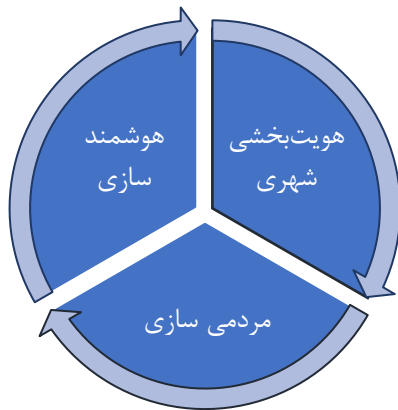
شکل ۱- تاکید بر ارکان سه گانه «هویت بخشی شهری»، «مردمی سازی» و «هوشمندسازی»

فرهنگی، صنایع دستی و گردشگری، وزارت راه و شهرسازی و غیره می‌باشد که هر روز به اهمیت آن افزوده می‌شود. تاکید بر ارکان سه گانه «هویت بخشی شهری»، «مردمی سازی» و «هوشمندسازی» در جهت حرکت به سمت چشم انداز تهران؛ کلانشهر الگوی جهان اسلام در حوزه رئیس سازمان زیباسازی شهر تهران، نقطه عطف مهمی محسوب می‌شود. در عمل، به منظور هویت بخشی به سیما و منظر شهر تهران، بخش مهمی از تجربه تحقق تحقق چشم انداز «تهران؛ کلانشهر الگوی جهان اسلام» و ابعاد مختلف آن است. (شکل ۱)