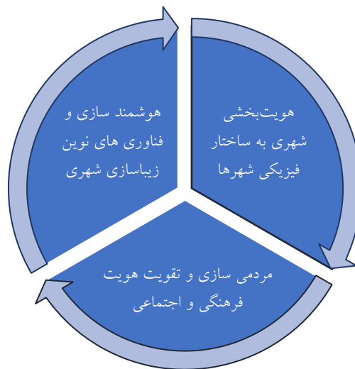
شکل ۵- تاکید بر ارکان سه گانه «هویت بخشی شهری»، «مردمی سازی» و «هوشمندسازی»