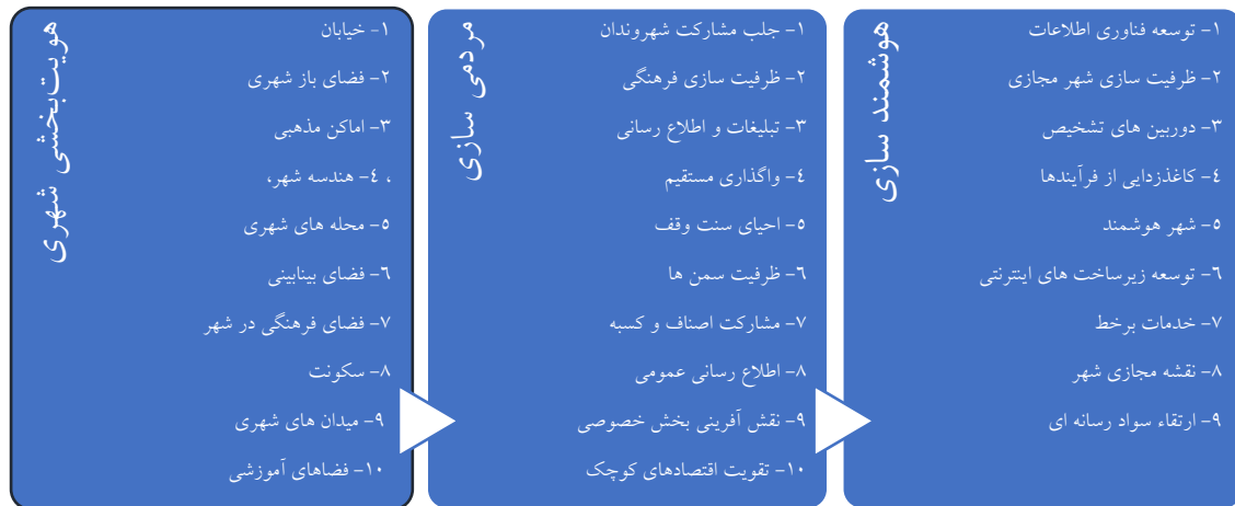
شکل ۴- اولویت های بهره گیری از ظرفیت های میراث معاصر تهران برای دستیابی به هویت اسلامی ایرانی شهر تهران در راستای تحقق چشم انداز «تهران؛ کلانشهر الگوی جهان اسلام» و ابعاد مختلف آن