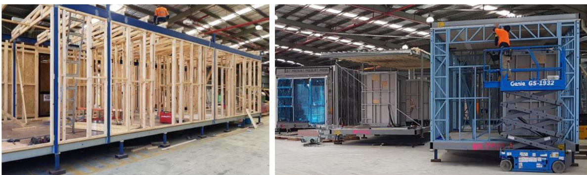
شکل شماره ۱. ساخت مدول‌های پیش‌ساخته در کارخانه [۳۵]