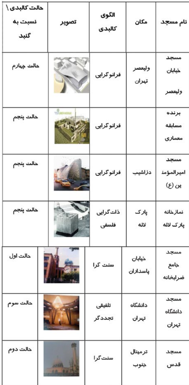
جدول ۲. بررسی نمونه‌های مساجد از لحاظ جایگاه گنبد (مأخذ: نگارندگان)