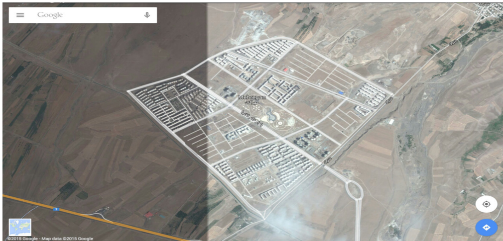
تصویر ۲ پایین: منطقه شهری مهرگان - قزوین، بالا مناطق مورد مطالعه در منطقه شهری مهرگان. ماخذ: URI4