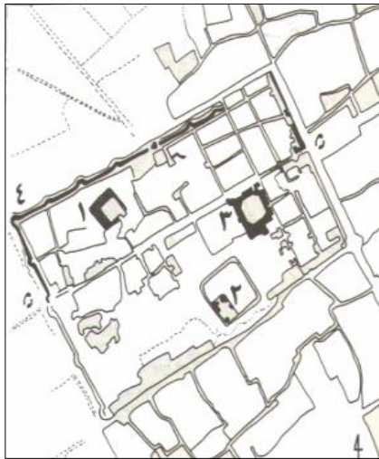
شکل شماره (۱) طیس: ۱. مسجد جامع ۲. ارگ، ۳. مدرسه ۴. بارو ۵. دروازه. (سلطان زاده، ۱۳۶۵: ۲۹۶)

در شهرهای خطی که شهر در حول یک محور ارتباطی شکل می گرفته، همانند سایر شهرها، مسجد در کنار عناصر دیگر در ساماندهی کالبدی شهر اهمیت داشته است.