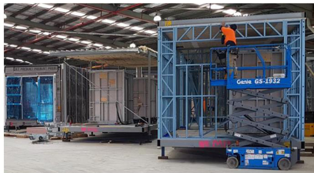
شکل شماره ۱. ساخت مدول‌های پیش‌ساخته در کارخانه [۳۵]