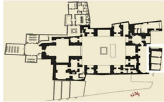
نگاره ۲ پلان مسجد مدرسه شفیعیه

به درون صحن و ایجاد اخلاص در زندگی آرام طلاب نباشند. در مدرسه شفیعیه نیز می‌توان دید که به ورودی به شبستان از هشتی است و نمازگزاران عمومی بدون وارد شدن به صحن، وارد شبستان می‌شوند (نگاره ۳).