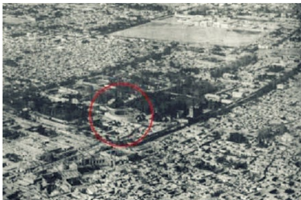
شکل ۳. تکیه دولت در کنار عمارت‌های دارالخلافه

تکیه دولت از دو جنبه دارای ویژگی‌های ارزنده است. اول اینکه بخشی از تاریخ معماری و شهرسازی ایران است که در پی یک تداوم تاریخی و با نگاهی به تحولات صنعتی غرب شکل گرفته بود. در درجه دوم درون‌مایه تکیه دولت، فضایی برای اجرای نمایش سنتی تعزیه بود که ریشه‌های طولانی در تاریخ شیعه داشته و با تخریب آن در واقع سیر قهقرایی این شیوه نمایشی را شاهد بودیم (Pourmand and Lezgi, 2008). در تکیه بزرگ و با شکوه دولت که به دستور ناصرالدین‌شاه مجاور محله ارگ ساخته شده بود؛ در روزهای عزاداری مجالس تعزیه با تجمل و شکوه بسیار و با شرکت بهترین خوانندگان (با لباس‌های فاخر و گاه مزین به جواهر) در حضور شاه برگزار می‌شد (Mashhoun, 2009).