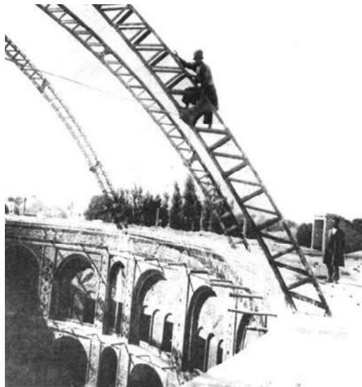
شکل ۴. سازه سقف تکیه دولت (مأخذ: http://architect.nemoneh.com )

در تکیه، منبری بیست‌پله‌ای (یا چهارده پله‌ای (Forugh, 1965) قرار داشت که دو دیواره جانبی آن از مرمر یکپارچه بود. بلندی آن حدود یک طبقه تکیه بود و به سفارش معیرالممالک در یزد ساخته شده بود (Zoka, 1970; Mansourifard, 1996). این منبر را در زمان انقلاب مشروطه از تکیه خارج کرده و در میدان توپخانه گذاشته بودند و شیخ فضل‌الله نوری بر آن سخنرانی می‌کرد (He-dayat, 1984). در چهار طرف تکیه، حوض‌های پر آبی قرار داشت که نوجوانانی با لباس عربی، غالباً بر اساس نذر والدینشان، سقایی حاضران در تکیه را بر عهده داشتند (Ojhen, 1983). در زمستان برای تأمین گرما در چند جا منقل می‌گذاشتند (Forugh, 1965). بر اساس وصف‌هایی که از فضای داخلی تکیه دولت برجا مانده است، می‌توان گفت که تزئین در آن بیش از معماری کلی و نمای بیرونی اهمیت داشته است، به‌ویژه استفاده از شمع‌دان‌های چند شاخه و دیوارکوب‌ها و چلچراغ‌ها و شمع‌ها و مانند این‌ها که نورپردازی فضای تکیه را چشمگیر می‌کرد. چلچراغی در وسط سقف قرار داشت (Forugh, 1965). که چندی با نیروی برق روشن می‌شد (Curzon, 1970). بخشی از نور تکیه، به‌ویژه سکوی وسط، از چراغ‌های لاله فنی با کاسه بلور که فراش‌ها حمل می‌کردند، تأمین می‌شد (Mostofi, 2005).