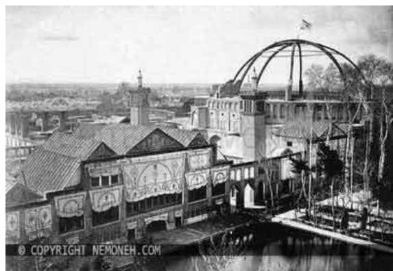
شکل ۲. دارالخلافه ناصری

تکیه دولت، بزرگ‌ترین آملی‌تئاتر ایران در دوره قاجاریه و به دستور ناصرالدین‌شاه ساخته شد (Pourmand and Lezgi, 2008). ساختمان تکیه دولت مدور آجری به قطر تقریبی شصت متر و ارتفاع حدود بیست و چهار متر بود و مساحتش را دو هزار و هشتصد و بیست و چهار متر مربع ذکر کرده‌اند. این ساختمان سه طبقه و با سردابه چهار طبقه داشت (Riyahi, 1968). در اطراف صحن بیست طاق (هر یک به عرض هفت و نیم متر)، با دیوارها و ستون‌های کاشی‌کاری قرار داشت. روی طاق‌ها اتاق‌هایی در دو طبقه ساخته شده بود. اتاق‌های طبقه اول ویژه وزرا و حکام ولایات بود که با نظارت ناظر (کارپرداز کاخ، فراشبافی) میان ایشان تقسیم می‌شد (Ojhen, 1983). اتاق‌های طبقه دوم ارسلی داشت و مخصوص بانوان حرم بود (Orsolle, 1973). طبقه سوم جایگاه نقاره‌چی‌ها بود که با نرده‌ای حفاظت می‌شد (Ojhen, 1983). کارگردان و مدیر تعزیه را معین‌الکاء می‌گفتند. معین‌الکائی که تعزیه‌گردان تکیه دولت بود، خود موسیقیدانی مطلع بود و در کار خود مهارت داشت. در هر گوشه از ایران که خواننده یا تعزیه‌خوان خوش‌صدایی می‌دید، او را به مرکز می‌آورد و وارد دستگاه خویش می‌کرد (Mashhoun, 2009).