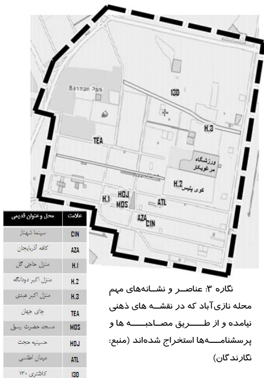
نگاره ۳: عناصر و نشانه‌های مهم محله نازی‌آباد که در نقشه‌های ذهنی نیامده و از طریق مصاحبه‌ها و پرسشنامه‌ها استخراج شده‌اند

محله در گذشته خیلی سگ ولگرد داشته است و عناوین قدیمی چون خیابان شهزاد، شقایق (رحیمی)، کوشا (خداشرفی)، بوعلی شمالی (نیکنام)، کوچه‌درختی.