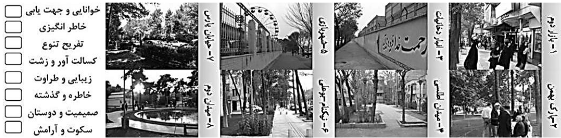
نگاره ۴: تصاویر منتخب و کیفیات مورد سنجش از شهروندان پیرامون تصاویر