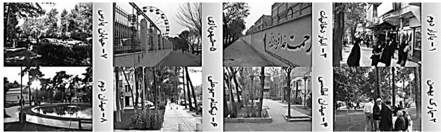
نگاره ۴: تصاویر منتخب و کیفیات مورد سنجش از شهروندان پیرامون تصاویر (منبع: نگارندگان)