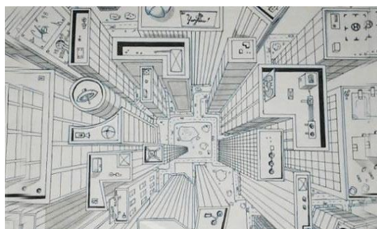
شکل ۱- تاثیر دیدگاه طراحی‌مبنا در ارتقای سیالیت ذهن فراگیران معماری و خلاقیت ایشان. (منبع http://designbuildsource.com.au - ۲۰۱۳-۰۱-۰۷)

البته لازم به ذکر است که آنچه در ادبیات تخصصی و مفاهیم کلیدی موضوع درباره نوآوری و خلاقیت گفته شده، نمونه‌ای از توجه به این مهم محسوب می‌شوند که این دو مفهوم علی‌رغم شباهت‌های زیاد، تفاوت‌های قابل توجهی نیز با یکدیگر دارند. از این‌رو می‌توان اینچنین نتیجه‌گیری کرد که بر اساس رویکرد انتخاب شده در پژوهش، نوآوری به معنای در نظر گرفتن توأم چندین موضوع پیچیده و دشوار، مانند مطلوب بودن، ممکن بودن، و مناسب بودن، خواهد بود.