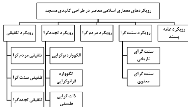
شکل ۱. رویکردهای مختلف طراحی کالبد مسجد

به‌طور خلاصه رویکردهای مختلف طراحی کالبد مسجد را می‌توان در شکل زیر خلاصه کرد: