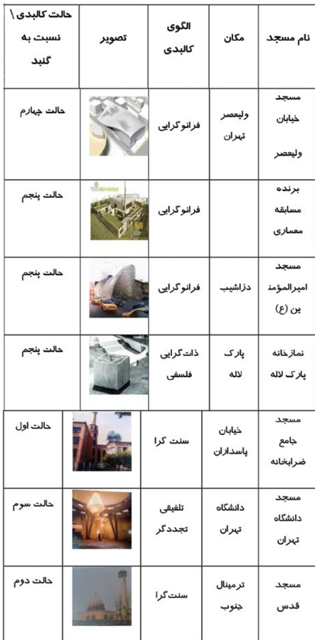
جدول ۲. بررسی نمونه‌های مساجد از لحاظ جایگاه گنبد